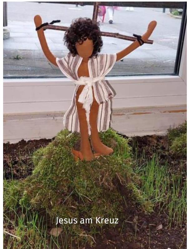
Jesus am Kreuz