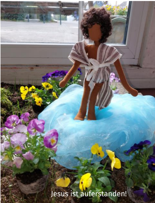
Jesus ist auferstanden!

Danach sind wir in unsere Gruppen gegangen uns dort hat ein tolles Frühstück auf uns gewartet, ein richtig leckerer Hefezopf. Die Kinder sind auch auf die Suche gegangen, im Flur waren Schoko-Lollies versteckt.