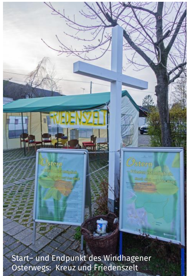
Start- und Endpunkt des Windhagener Osterwegs: Kreuz und Friedenszelt

Stationen sind so erreichbar - jede Station stellt eine Situation aus der biblischen Passionsgeschichte dar, angefangen mit Jesu Einzug in Jerusalem, über Abendmahl, Gethsemane, Verrat, Verleugnung, Verurteilung, Kreuztragung, Kreuzigung, Auferstehung bis hin zum Gang nach Emmaus. An den einzelnen Stationen fällt der Blick des Osterwanderers auf die Informationstafeln, die mit künstlerischer Grafik (von Otto Dix), biblischen Texten und passenden Erläuterungen sowie kindgerechten Bildern über die letzten Tage im irdischen Leben Jesu berichten. (rs)