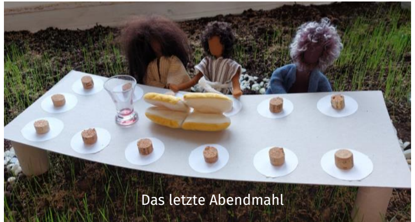
Das letzte Abendmahl