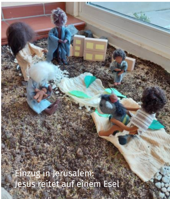
Einzug in Jerusalem: Jesus reitet auf einem Esel