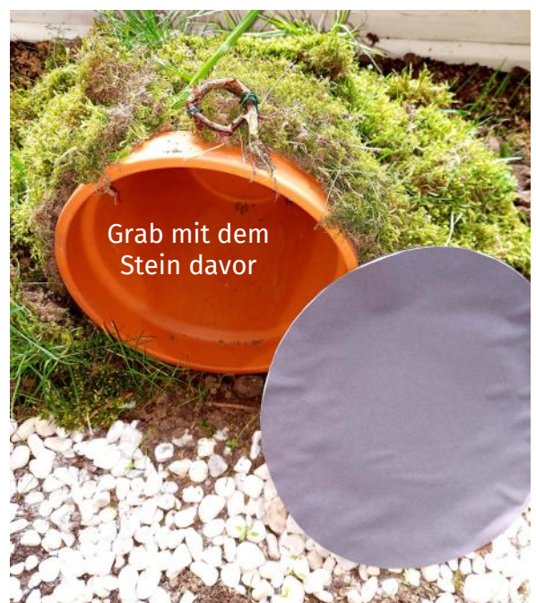
Grab mit dem Stein davor

Am Gründonnerstag hat unsere Osterfeier stattgefunden. Die Kinder haben sich sehr gefreut, denn in der letzten Geschichte haben sie gehört, dass Jesus auferstanden ist und dass er immer für uns da ist.