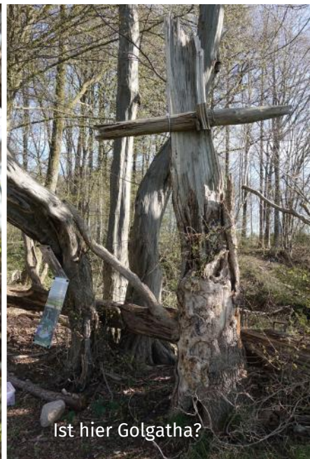
Ist hier Golgatha?