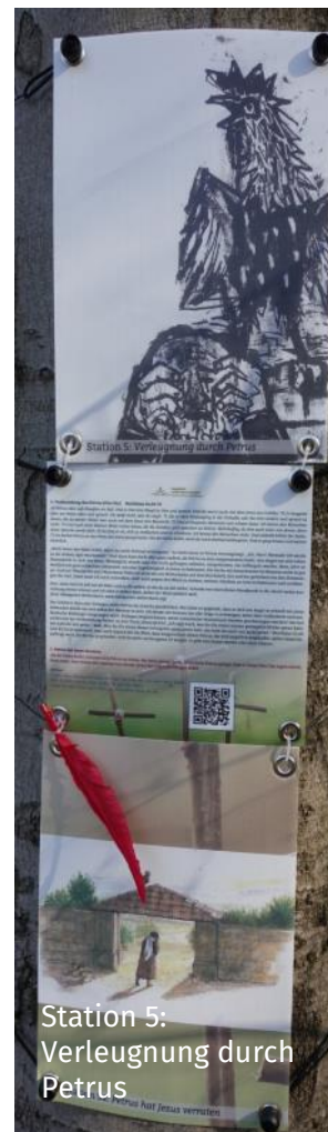
Station 5: Verleugnung durch Petrus