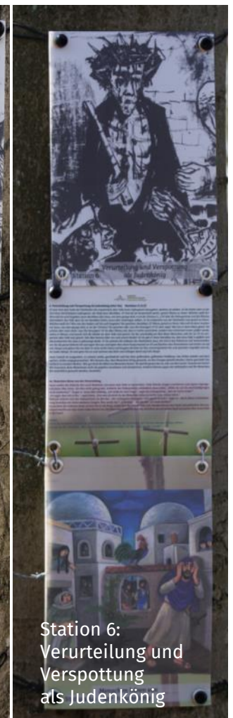
Station 6: Verurteilung und Verspottung als Judenkönig