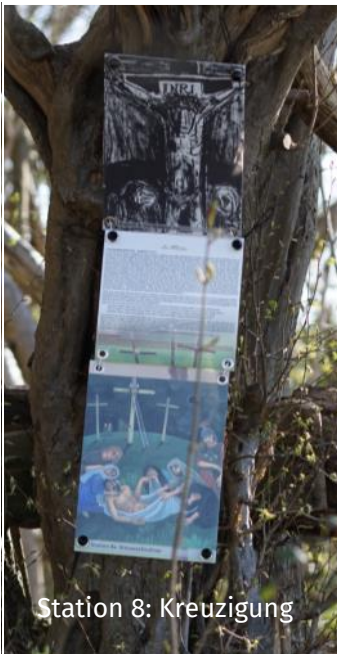
Station 8: Kreuzigung

Aber seit dem 11.4. steht hier nun ein neues Friedenszelt. Danke für die Initiative, so schnell ein neues Zelt zu beschaffen und aufzustellen!