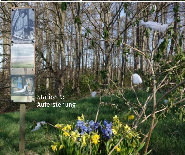
Station 9: Auferstehung

„Man muss sich durch die kleinen Gedanken, die einen ärgern, immer wieder hindurchfinden zu den großen Gedanken, die einen stärken.“