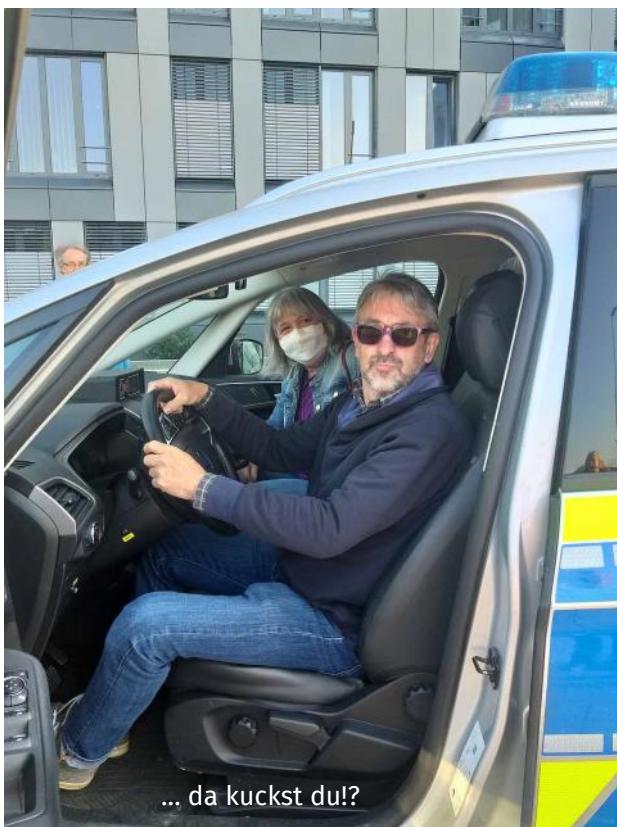
... da kuckst du!?