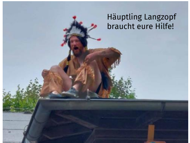
Häuptling Langzopf braucht eure Hilfe!