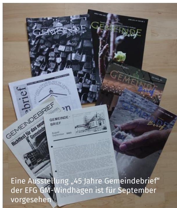
Eine Ausstellung „45 Jahre Gemeindebrief“ der EFG GM-Windhagen ist für September vorgesehen