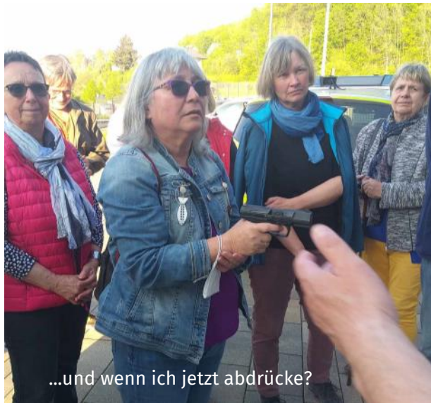
...und wenn ich jetzt abdrücke?

Aus Datenschutzgründen (DSVGO) wurden hier in der Web-Version Inhalte entfernt. Senden Sie bitte ein entsprechendes eMail an info@efg-gm.de , wenn Sie die Originalversion des Gemeindebriefs erhalten möchten.