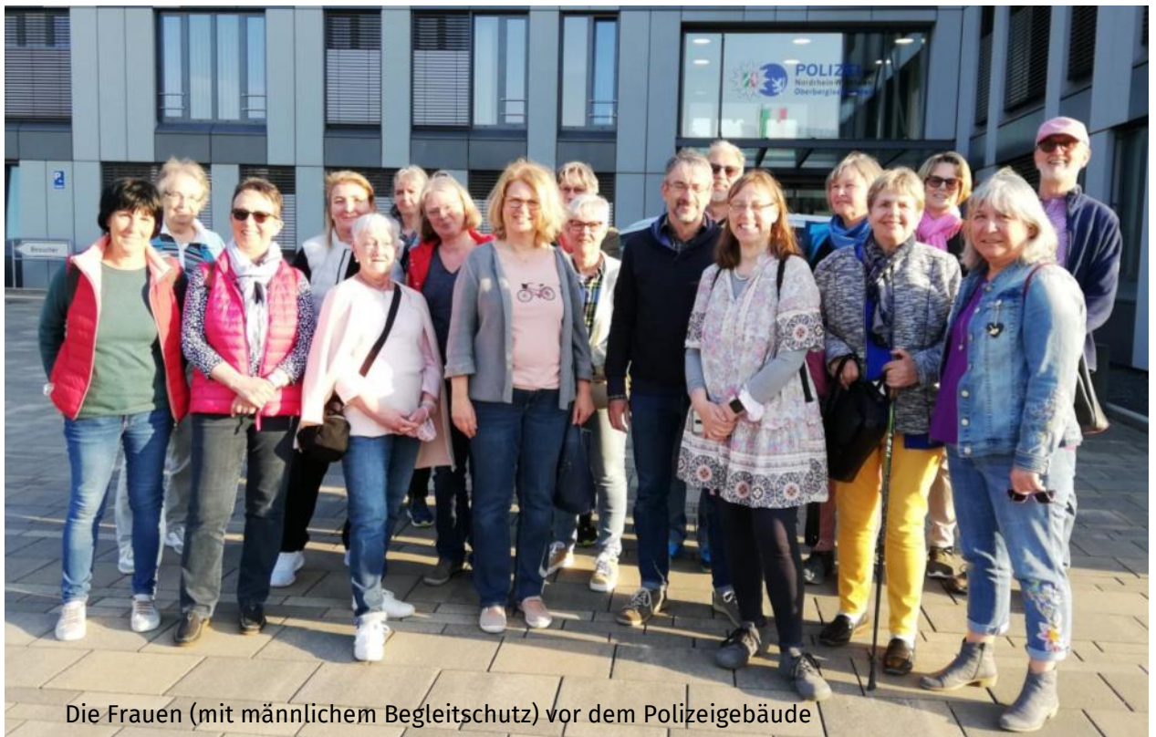
Die Frauen (mit männlichem Begleitschutz) vor dem Polizeigebäude